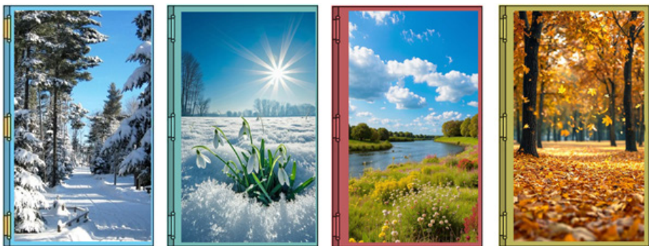
Рисунок 2. Мотивационное задание к уроку «Поэты о красоте родной природы: анализ авторских приемов создания художественного образа» (продолжение)

Далее с помощью анимации обучающиеся «открывают» каждую дверь (рис. 2) и описывают, что увидели, какие чувства испытали, глядя на фотографии, можно ли восхищаться картинами природы, кто из известных людей умеет восхищаться красотой природы, какие художественные произведения могут помочь почувствовать и описать картины природы, какие стихотворные строки вспомнились при рассматривании фотографий.