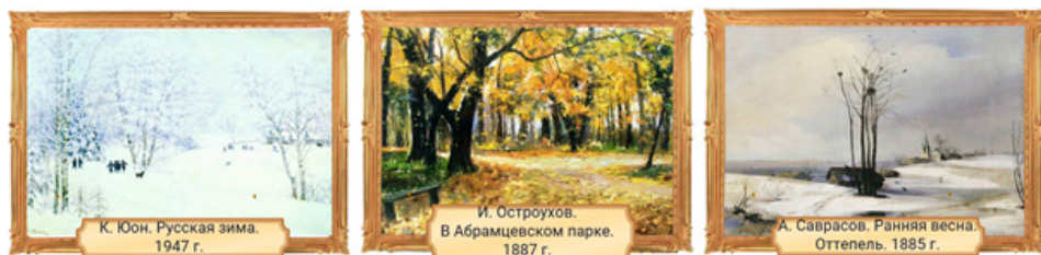
Рисунок 3. Задание 1 к уроку «Анализ настроения в стихотворении»

Задание 2 (повышенный уровень сложности). Рассмотрите репродукции картин. Отличаются ли средства в художественном искусстве от средств в лирических произведениях? Обоснуйте свое мнение. Приведите примеры из стихотворений (рис. 4).