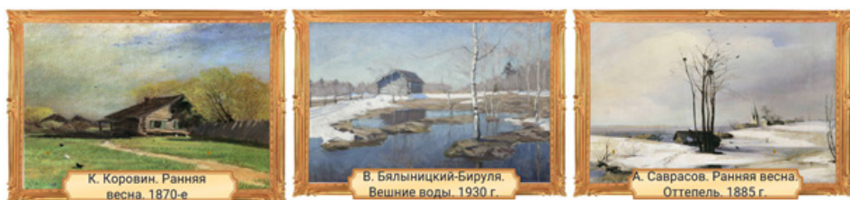
Рисунок 4. Задание 2 к уроку «Анализ настроения в стихотворении»

Задание 2 (повышенный уровень сложности). Рассмотрите репродукции картин. Отличаются ли средства в художественном искусстве от средств в лирических произведениях? Обоснуйте свое мнение. Приведите примеры из стихотворений (рис. 4).